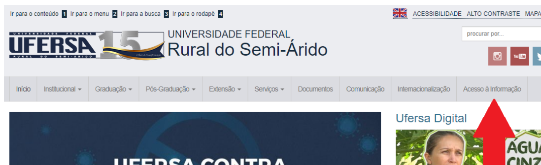
Figura 2.1: Item "Acesso à Informação" no menu inicial do portal da UFERSA.

Por Transparência ativa entende-se a divulgação, independente de solicitação, de informações de interesse público geradas e mantidas por órgãos e entidades públicas em seus sítios eletrônicos. No caso da UFERSA, estas informações são apresentadas em seu portal ( ufersa.edu.br ) na aba “Acesso à Informação”, conforme imagem 2.1: