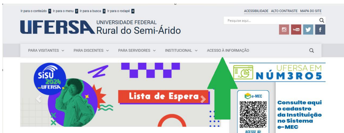
Figura 1: Indicação da aba Acesso à Informação na página da UFERSA

Neste item analisaremos os indicadores de Transparência Ativa extraídos do Painel LAI e no Sistema de Transparência Ativa (STA).